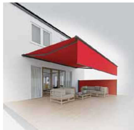
Tende da sole, volant e tenda laterale Illuminazione LED Volant Plus Tenda laterale in tessuto Paravento