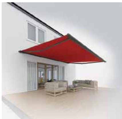
Tende da sole Illuminazione LED

Con il trasmettitore portatile radiocomandato Griesser potete comandare comodamente la vostra tenda direttamente dalla sdraio. Non per niente il motto è: Griesser, schermature solari – una scelta automatica.