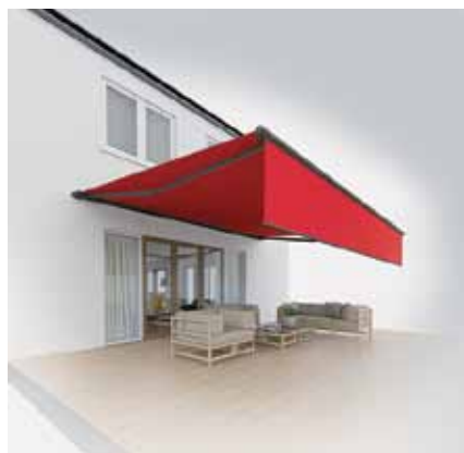
Tende da sole e volant Illuminazione LED Volant Plus